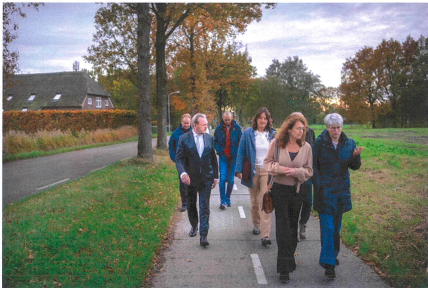
▲ De nationale ombudsman (links) op werkbezoek in Ekehaar.

Bij zijn burens, met huizen uit dezelfde bouwperiode en vergelijkbare schade, was het wél 'redelijkerwijs aannemelijk' dat scheuren groter waren geworden door de bevingen, bij Blok niet. „Er is geen touw aan vast te knopen”, zegt hij. Ingediende zienswijzen veranderden daar niets aan.